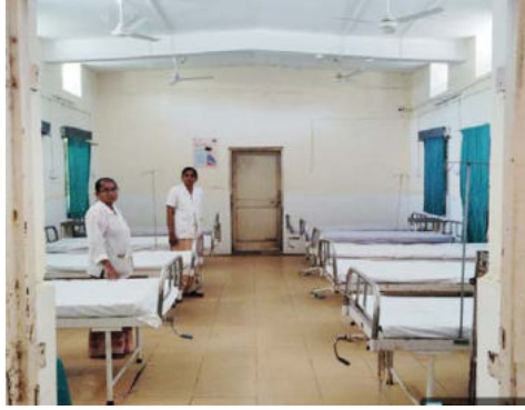
भागात कोणतीही ठोस वैद्यकीय व्यवस्था नसल्याचे वास्तव 'दै. जनमाध्यम'ने उघड करतच नागरिकांमध्ये संताप उसळला. या

बाढल्या तापमानाने नागरिक हैराण झाले असताना, जीवघेण्या उष्माघाताचा धोका डोक्यावर असतानाही प्रशासन मात्र गाढ झोपेत होते. शहरासह ग्रामीण