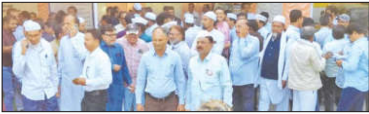
प्राथमिक शिक्षक समितीचे मुख्यमंत्री व शिक्षणमंत्र्यांना निवेदन