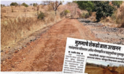
खडकांची शेकडो ब्रास अवैध वाहतूक; महसूल विभाग झोपेत? खणवण-घाटणीने वीरलगत खणवण, लवचक कलमानी विहिरीतील खडकांचा वसाव

१ ते ५ मार्च दरम्यान रात्रीच्या वेळी विहिरीतील खडक व मुमुम्पाचे मोठ्या प्रमाणात उत्खनन करून