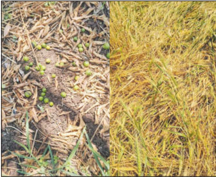
तालुक्यात अंदाजे, १० हेक्टर वरील कांदा, गहू, भाजीपाला या रब्बी पिकांचे वादळी पावसामुळे

चांदूरबाजार/वार्ताहर तालुक्यात ३० मार्चला रात्री साडे आठच्या सुमारास, तुफानी वादळासह पाऊस झाला. या वादळी पावसामुळे तालुक्यातील, रब्बी पिकांचे नुकसान तर झालेच.त्याच सोबत तालुक्यात वादळी पावसाचा, १७ हजार १६१ हेक्टर वरील संत्रा पिकाला ही चांगलाच दणका बसला आहे.या वादळी पावसामुळे संत्राच्या, आंबिया बहाराचे मोठे नुकसान झाले आहे.परिणामी यांचा संत्रा उत्पादक शेतकऱ्यांना मोठा आर्थिक फटका बसला आहे.त्यामुळे या नैसर्गिक आपत्ती मुळे झालेल्या नुकसानीचे पंचनामे करून, शेतकऱ्यांना आर्थिक मदत देण्यात यावी.अशी मागणी संत्रा उत्पादक शेतकऱ्यांकडून केल्या जात आहे.