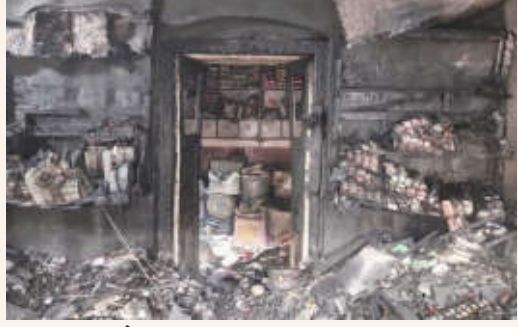
पहाटे लागलेल्या आगीत लक्ष्मी किराणा स्टोअर्स पूर्णतः जळून खाक झाले.

वर्धा जनमाध्यम : शहरातील गजबजलेल्या नेहरू बाजार परिसरात शुक्रवारी (दि. २४) पहाटे लागलेल्या आगीत लक्ष्मी किराणा स्टोअर्स पूर्णतः जळून खाक झाले. या आगीत किराणा मालासह दुकानातील साहित्याची मोठ्या प्रमाणात हानी झाली असून लाखो रुपयांचे नुकसान झाल्याचा प्राथमिक अंदाज व्यक्त करण्यात येत आहे.