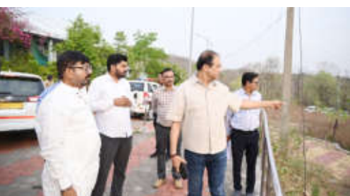
व्हीआयपी सूट, वसतिगृह, मीटिंग हॉल, फर्निचर व इंटरियर कामेही हाती घेण्यात आली आहेत. या कामांसाठी जिल्हा

देशभरातून पर्यटक येथे येतात. आता धरण परिसराचा पर्यटनदृष्ट्या विकास केल्याने पर्यटकांना व्याघ्र दर्शनासोबतच बोटिंग आणि अन्य सुविधा अनुभवता येणार आहेत. पर्यटन विभागासाठी आतापर्यंत १० कोटी २३ लाख रुपयांची कामे मंजूर झाली आहेत. यात जेटी उभारणी, बोटिंग व्यवस्था, सफारी वाहनांची सुविधा, तसेच राहाटी व ढगा गेट सुरू करून पर्यटकांसाठी प्रवेश सुलभ करण्यात आला आहे. याशिवाय, बोरधरण परिसरातील रिसॉर्टचा विकास,