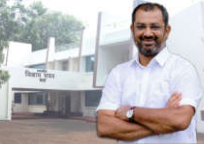
खासदार अमर काळे

महात्मा महात्मा गांधी आणि विनोबा भावे यांच्या साधेपणाच्या भूमीतच व्हीआयपी संस्कृतीचा हा दिखाऊ थाट उभारला जात असल्याने जनतेत संतापाची लाट उसळत आहे. जनतेचे प्रश्न की व्हीआयपींचा आराम हा प्रश्न आता चहाटळ्यांपासून राजकीय व्यासपीठापर्यंत घुमू लागला आहे.