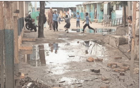
फायद्यासाठीच राबवली जात असल्याचा आरोप होत आहे. स्थानिकांमध्ये अशीही चर्चा आहे

करता घाईघाईत उरकण्यात आले होते. दोन दिवसांपूर्वी झालेल्या किरकोळ पावसातच या कामाची पोलखोल झाली. ठिकठिकाणी पेव्हर ब्लॉक खचले असून कामाच्या गुणवत्तेवर प्रश्नचिन्ह निर्माण झाले आहे. विद्यार्थ्यांच्या सोयीसाठी करण्यात आलेल्या या कामावर लाखो रुपये खर्च झाले असले, तरी प्रत्यक्षात हा निधी वाया गेल्याची भावना ग्रामस्थांमधून व्यक्त करीत आहेत. पेव्हर ब्लॉक योजना ही नागरिकांच्या सोयीपेक्षा संबंधित अधिकारी व कंत्राटदार यांच्या