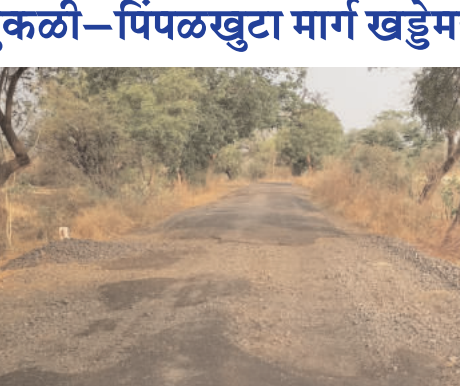
डांबरीकरणासाठी निकृष्ट साहित्याचा वापर झाल्याचा आरोपही नागरिकांकडून करण्यात येत आहे. अडीच वर्षांतच नव्या रस्त्याची चाळणी होणे

ही गंभीर बाब असून, संबंधित अधिकाऱ्यांनी तातडीने दखल घेऊन रस्त्याची दुरुस्ती करावी, अशी मागणी जोर धरत आहे. सहा कोटी २४ लाखांचा खर्च वाया? सुकळी-पिंपळखुटा रस्त्याच्या डांबरीकरणासाठी सुमारे सहा कोटी २४ लाख रुपये खर्च करण्यात आले होते. मात्र, निकृष्ट दर्जामुळे रस्ता अल्पावधीतच खराब झाल्याने हा खर्च पाण्यात गेल्याचे चित्र आहे. पाच वर्षांच्या हमी कालावधीत दुरुस्ती अपेक्षित असतानाही कामाकडे दुर्लक्ष होत असल्याची खंत नागरिक व्यक्त करत आहेत. कार्यक्षमतेवर प्रश्नचिन्ह प्रधानमंत्री ग्रामीण सडक योजनेअंतर्गत करण्यात आलेल्या या कामाची गुणवत्ता संशयास्पद ठरत आहे. पाच वर्षांच्या कालावधीत रस्त्याची देखभाल व दुरुस्ती करण्याची जबाबदारी संबंधित विभागाची असतानाही प्रत्यक्षात कोणतीही कारवाई होत नसल्याने विभागाच्या कार्यक्षमतेवर प्रश्नचिन्ह उपस्थित होत आहे.