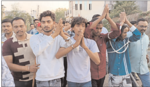
प्रतिनिधी | अकोला

शहरातील कौलखेड-खडकी परिसरात घडलेल्या मारहाण व जीववेण्या हल्ल्याच्या सलग घटनांमुळे निर्माण झालेल्या दहशतीला अखेर पोलिसांनी ८ तासांतच आळा घातला. स्थानिक गुन्हे शाखेच्या (थॅ) पथकाने बार्शाटाकडी तालुक्यातील जंगल परिसरातून सर्व आरोपींना जेरबंद करत त्यांच्या ताब्यातील तीन मोटारसायकली जप्त केल्या. या घडामोडीबाबत कारवाईमुळे शहरात पोलिसांची दहशत पुन्हा प्रस्थापित झाल्याचे चित्र आहे. पोलीस स्टेशन खदान हद्दीत ४ एप्रिल २०२६ रोजी कौलखेड व खडकी भागात वेगवेगळ्या ठिकाणी मारहाण व जीववेण्या हल्ल्याच्या तीन गंभीर घटना घडल्या होत्या. या प्रकरणी गुन्हा क्रमांक ८५५/२०२६, ८५६/२०२६ व