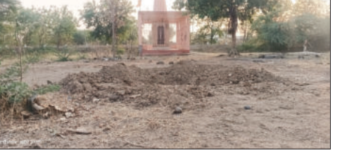
धन काढण्याचा प्रयत्न काल शनिवारी (दि.४) उघडकीस आला असून या प्रकरणी तांत्रिकासह चार आरोपींना

-अंबादेवी साखर कारखाना परिसरातील घटना अंजनगाव सुर्जी / प्रतिनिधी:- अंजनगाव सुर्जी तालुक्यातील दहीगाव रेशा-शेरागाव मार्गावरील बंद अवस्थेत असलेल्या अंबादेवी साखर कारखाना परिसरातील आसरा देवीच्या मंदिरा समोर जादूटोण्याच्या माध्यमातून गुप्त