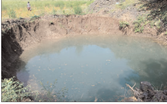
पडल्याने शेतीचे मोठे नुकसान झाले आहे. शासनाकडून अशा नुकसानीसाठी अनुदानाची तरतूद असतानाही प्रत्यक्षात लाभार्थ्यांना मदत मिळालेली नाही, अशी तक्रार शेतकऱ्यांनी व्यक्त केली आहे.

पातूर तालुक्यातील अतिदुर्गम सावरगाव परिसरात अतिवृष्टीमुळे गाळलेल्या विहिरींच्या लाभार्थ्यांना अद्यापही शासकीय अनुदान मिळाले नसल्याचा प्रकार समोर आला आहे. जिल्ह्याच्या शेवटच्या टोकावर असलेल्या या भागातील शेतकरी प्रशासनाच्या दिरंगाईमुळे संतप्त झाले असून तातडीने मदत देण्याची मागणी करत आहेत.