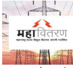
लाभ झाला आहे. राज्यातील उच्चदाब व लघुदाब अशा ११,०९७ वाणिज्यिक ग्राहकांना एकूण २२३५ कोटी रुपयांचा लाभ झाला आहे. घरगुती ग्राहकांना टीओडीचा लाभ मिळण्यास सुरुवात झाल्यापासून त्यांना १,०९६ दशलक्ष युनिट इतक्या विजेसाठी ८९ कोटी रुपयांचा

लाभ झाला आहे. राज्यातील सौरऊर्जेसारख्या नवीकरणीय उर्जेची उपलब्धता वाढली आहे. ही वीज स्वस्त मिळत असल्याने महावितरणने महाराष्ट्र विद्युत नियामक आयोगाच्या आदेशानुसार दिवसाच्या वीजवापरासाठी सवलत लागू केली आहे. वीज ग्राहकांनी अधिक विजेची गरज असणारी उपकरणे सकाळी ९ ते सायंकाळी ५ या कालावधीत प्राधान्याने वापरून टीओडी सवलतीचा अधिकाधिक लाभ घ्यावा, असे आवाहन महावितरणतर्फे करण्यात आले आहे.