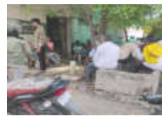
करण्याची मागणी केली आहे. अवैध मटका आणि जुगारामुळे अनेक कुटुंबांचे आर्थिक नुकसान होत असून सामाजिक वातावरण बिघडत असल्याचेही नागरिकांचे म्हणणे आहे.

चिंता व्यक्त केली जात आहे. स्थानिकांच्या म्हण्यानुसार, रोज मोठ्या प्रमाणात पैशांची उलाढाल या अवैध व्यवसायातून होत आहे. काही टिकाणी दिवसाढवळ्या मटका घेण्याचे प्रकार सुरू असल्याने पोलिस प्रशासनाच्या कारवाईवरही प्रश्नचिन्ह उपस्थित होत आहे. गावातील सुज्ञ नागरिकांनी या प्रकारावर तात्काळ कारवाई