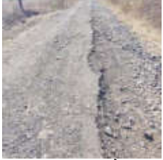
प्रत्यक्षात रस्त्यांची कामे निकट दर्जाची केली जातात किंवा काही ठिकाणी कामे होतच नसल्याचा आरोप केला जात आहे. अनेक रस्त्यांचे वारंवार भूमिपूजन व उद्घाटन करण्यात येते, मात्र काही महिन्यांतच रस्ते पुन्हा खड्डेमय होत असल्याने जनतेत नाराजी वाढत आहे. तालुक्यातील लोकप्रतिनिधींनी ग्रामीण भागातील रस्त्यांच्या प्रश्नाकडे पूर्णपणे दुर्लक्ष वेगल्याचा आरोप नागरिकांनी केला आहे.

पूर्णपणे उखडून गेले असून मोटमोठे खड्डे पडले आहेत. काही मार्गांवर गिट्टी बाहेर आली असून वाहन चालविणे धोकादायक झाले आहे. 'हा रस्ता आहे की शेताचा बांध?' असा प्रश्न वाहनचालकांकडून उपस्थित केला जात आहे. रस्त्यांवरील खड्ड्यांमुळे दुचाकीस्वार रोज अपघातग्रस्त होत आहेत. गंभीर रुग्णांना रुग्णालयात नेताना अम्बुलन्सला वेळ लागत असल्याने 'गोल्डन अवर' वाया जात आहे. एसटी बसेसचे नुकसान वाढल्याने काही ग्रामीण भागातील फेऱ्या बंद पडण्याच्या मार्गांवर आहेत. पंचवीस-पंधरा योजना, जिल्हा वार्षिक योजना तसेच आमदार निधीमधून दरवर्षी कोट्यवधी रुपयांचा निधी मंजूर होतो. मात्र