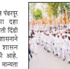
अनुदानाची रक्कम नोंदणीकृत दिंड्यांच्या खाल्यामध्ये जमा होत असल्याने मोठ्या संख्येने अकरा जिल्हांतून दिंड्या जमा होईल. ह्या दिंड्यांचे नियोजन व्यवस्थित न झाल्यास गर्दी अनियंत्रित होईल व परिणामतः होणाऱ्या गैरसोयीमुळे वारकरी भक्तांचे अत्यंत वाईट हाल होतील. त्यासाठी विदर्भातील मानाच्या पालखीच्या संख्येत तातडीने वाढ करावी,

अमरावती/का.प्र. आषाढी एकादशी यात्रानिमित्त तीर्थक्षेत्र पंढरपूर येथील वारीकरिता मानाच्या दहा पालख्यांसोबत येणाऱ्या दिंड्यांना प्रती दिंडी वीस हजार रुपये अनुदान देण्यास शासनाने १६ जुलै २०२५ रोजीच्या शासन परिपत्रकाद्वारे मान्यता प्रदान केली आहे. मात्र शासनाने ज्या दहा पालख्यांना मान्यता दिली आहे, त्या सूचीमध्ये विदर्भाच्या अकरा जिल्हांतून फक्त श्री विठ्ठल-रुक्मिणी संस्थान, श्रीक्षेत्र कौडण्यपूर, जि. अमरावती ह्या केवळ एकाच तीर्थक्षेत्राचा समावेश केलेला आहे. अकरा जिल्हांमधील वारकरी दिंडी-प्रमुखाना आपल्या हजारां सहकारी वारकऱ्यांसह दिंड्या घेऊन कौडण्यपूरच्या मानाच्या पालखीसोबत पंढरपूरला जायचे आहे; अन्यथा हे अनुदान मिळणार नाही. शिवाय दिंड्यांना मिळणाऱ्या