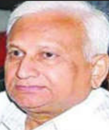
असून समन्वय समितीत विविध क्षेत्रातील मान्यवरांचा समावेश आहे.

स्मृती प्रतिष्ठान, आम्ही सारे फाऊंडेशन, संत गाडगेबाबा ज्येष्ठ नागरिक मंडळ, संवेदना फाऊंडेशन, सुजन साहित्य संघ, बांधिलकी फाऊंडेशन, सर्जनशील शब्दवेल साहित्य संघ, विदर्भ राज्य आंदोलन समिती, स्त्री संवेदना मंच, पायगुण प्रकाशन, मेधा पब्लिकेशन, अक्षरशिल्प प्रकाशन, पालवी फाऊंडेशन, आयएएस अकादमी आणि आदिशक्ती बहुउद्देशीय संस्था आदी संस्थांचा सहभाग लाभला