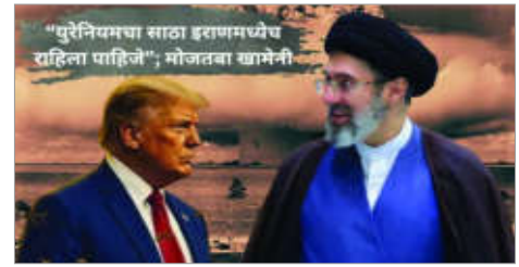
युरेनियमचा साठा इराणमध्येच राहिला पाहिजे', मोजतबा खामेनी

युरेनियमबाबत मोजतबा यांनी स्पष्ट केली भूमिका अमेरिका आणि इराण यांच्यात सुरु असलेल्या शांतता चर्चेत इराणचा आण्विक कार्यक्रम हा महत्वाचा मुद्दा आहे. इराणकडे कधीच अण्वस्त्र असू नये अशी