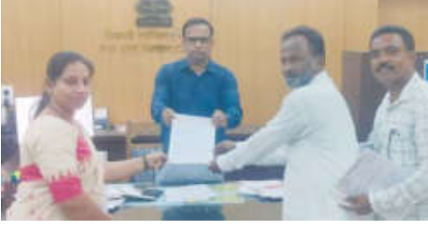
देण्यासाठीच हा डाव रचल्याचा गंभीर आरोप करण्यात आला असून या प्रकरणी जिल्हाधिकारी

विधान परिषद निवडणुकीची आचारसंहिता लागू असतानाच चांदूर रेल्वे नगरपरिषदेत विकास कामांच्या निविदा प्रक्रियेत मोठा गोंधळ उडाल्याचा आरोप समोर आला आहे. निविदा भरण्याची मुदत संपत असताना अचानक शुद्धीपत्रक काढून मुदतवाढ देण्यात आल्याने नगरपरिषद प्रशासनाच्या कारभारावर संशयाचे सावट गडद झाले आहे. तांत्रिक अडचणीचे कारण पुढे करत काही ठरावीक कंत्राटदारांना लाभ मिळवून