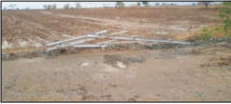
परिसरातील अनेक गावांचा वीजपुरवठा विस्कळीत झाला आहे.