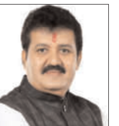
पोहरादेवी येथील बंजारा विरासत संग्रहालयाची करणार पाहणी

सकाळी ०९:०० ते १०:३० वाजता पोहरादेवी येथील 'बणजारा विरासत संग्रहालयाची' प्रत्यक्ष पाहणी व आढावा सकाळी १०:३० वाजता: पाहणी दौरा आटोपून हेलिकॉप्टरने पुढील कार्यक्रमासाठी यवतमाळकडे रवाना होतील.