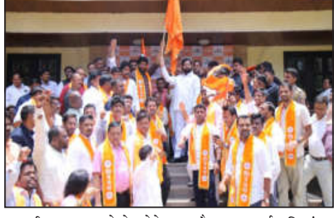
सकाळी ११ वाजता बेलोरा येथे ग्रामदैवत व आई-वडिलांच्या

१२.३० वाजता रायगड किल्ल्याच्या पायथ्याशी पाचाड येथे मुक्काम, त्यानंतर १ मे सकाळी ११ वाजता रायगड किल्ल्यावर छत्रपती शिवाजी महाराजांना वंदन व माँ जिजाऊ यांच्या समाधीचे दर्शन, त्यानंतर दुपारी १.३० वाजता मुंबईकडे प्रस्थान करून सायंकाळी ८ वाजता नागपूर विमानतळावर आगमन, तर रात्री ११.३० वाजता कुरळपूर्णा येथे दाखल होणार आहे. आणि २ मे रोजी