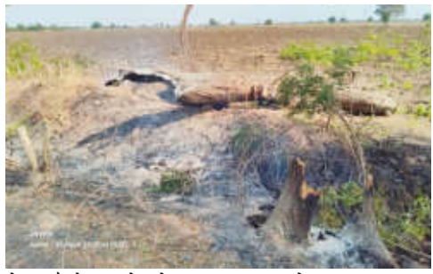
होती. सुदैवाने या घटनेत कोणतीही जीवितहानी झाली नाही. घटनेची माहिती मिळताच संबंधित विभागाने गुरुवार, दि.

आसेगाव पूर्णा/प्रतिनिधी:- चांदूरबाजार तालुक्यातील जवळ शहापूर ते खरवाडी रस्त्यावर काल रात्री अज्ञात व्यक्तीने कडूनिंबाच्या झाडाला आग लावल्याची घटना घडली. आगीमुळे झाड जळून कमकुवत झाल्याने ते थेट विद्युत वितरण कंपनीच्या खांबावर कोसळले. या घटनेत वीजखांब वाकून त्याचे नुकसान झाले. दरम्यान, खांबावर जिवंत प्रवाह असलेल्या ताप असल्यामुळे मोठी दुर्घटना होण्याची शक्यता