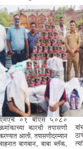
एमएच ०१ बा०एस ५०८० क्रमांकाच्या कारची तपासणी करण्यात आली. तपासणीदरम्यान वाहनात बागबान, बाबा ब्रॅक,

तळेगाव (श्या. पं.) जनमाध्यम : राष्ट्रीय महामार्ग क्रमांक ६ वरून अवैधरित्या प्रतिबंधित गुटखाची वाहतूक करणारे वाहन तळेगाव पोलिसांनी ताब्यात घेत मोठी कारवाई केली. या कारवाईत ४ लाख ४ हजार ७८५ रुपयांचा गुटखा आणि ५ लाख रुपये किमतीचे वाहन असा एकूण ९ लाख ४ हजार ७८५ रुपयांचा मुद्देमाल जप्त करण्यात आला. मिळालेल्या माहितीनुसार, पांडुर्णा (मध्यप्रदेश) येथून तळेगावमार्गे चांदूर रेल्वेकडे गुटखा नेला जात असल्याची माहिती पोलिसांना मिळाली होती. त्यानुसार अमरावती मार्गावर