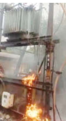
नागरिकांनी तत्काळ प्रसंगावधान दाखवत आग विझवण्याचा

वर्धा जनमाध्यम : शहरातील वाढत्या तापमानाचा परिणाम आता वीज यंत्रणेवरही दिसून येत आहे. वर्धात सांमवार ४७.१ अंश सेल्सिअस तापमानाची नोंद झाली असताना पॅंथर चौक परिसरातील विद्युत डीपीला अचानक आग लागल्याची घटना घडली. या घटनेमुळे रामनगर बजाज चौक सानेवाडी या परिसरात काही काळ वीजपुरवठा खंडित झाला होता. दुपारच्या सुमारास डीपीमधून धूर निघत असल्याचे नागरिकांच्या निदर्शनास आले. काही क्षणांतच आगीने मोठे स्वरूप धारण केले. परिसरातील