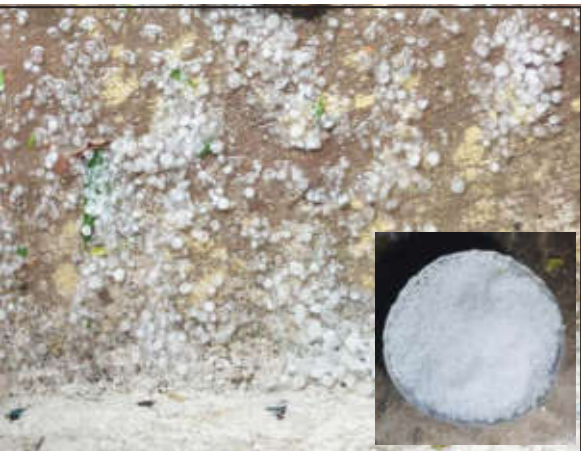
दरम्यान, मुसळधार पाऊस आणि जोरदार वाऱ्यामुळे