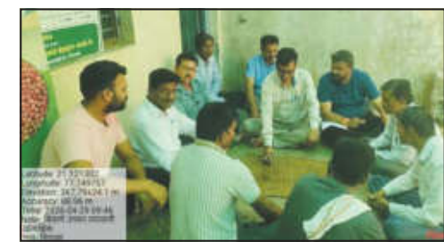
बाबत मार्गदर्शन केले. बीजप्रक्रिया केल्यास पिकांचे रोगांपासून संरक्षण होऊन उगवण चांगली

उगवणक्षमता तपासण्यासाठी ओल्या गोणपाटामध्ये किंवा कागदामध्ये ठरावीक प्रमाणात बियाणे ठेवून त्यांची उगवण टक्केवारी कशी मोजावी, याची माहिती दिली. जर उगवणक्षमता ६० टक्क्यांपेक्षा कमी आढळली, तर ते बियाणे पेरणीसाठी वापरू नये, असेही त्यांनी स्पष्ट केले. तसेच, बियाणे प्रक्रिया करण्याचे महत्त्व अधोरेखित करताना त्यांनी FIR पध्दतीने औषधांचा योग्य क्रम व वापर कसा लावावा, या