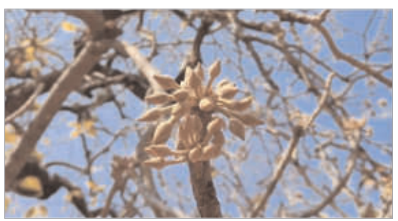
संकलनानंतरही 'मोहा बँक' प्रकल्पाकडे दुर्लक्ष मोहफुले हे अस्वलांचे खाद्य असल्याने, ही फुले वेचताना

पहाटे पासून महिला, पुरुष आणि मुले जंगलात जाऊन ही फुले वेचण्याचे काम करतात. पहाटेच्या वेळी ही फुले गळून पडतात. त्यामुळे सकाळी लवकर उठून मोहफुले गोळा करण्यासाठी जावे लागते. एका कुटुंबाकडून दिवसाला साधारण १५ ते २० किलो मोहफुलांचे संकलन केले जाते. वेचलेली मोहफुले वाळवून त्याची विक्री केली जाते. सध्या बाजारात ५० ते ६० रुपये प्रतिकिलो दर मिळत आहे. मात्र, हे काम जोखमीचे असते.