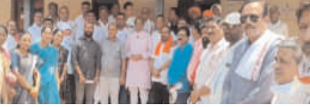
आंदोलनाच्या तीनही प्रकरणातून निर्दोष मुक्तता