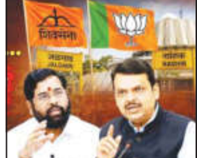
मोर्चेबांधणी सुरू केली असून, विविध माध्यमांतून आपली ताकद दाखवण्याचा प्रयत्न केला जात आहे. मात्र दुसरीकडे शिवसेनेकडूनही जळगावची जागा प्रतिष्ठेची मानली जात असल्याने त्यांनी कोणत्याही परिस्थितीत ही जागा सोडण्यास स्पष्ट नकार दिल्याचे समोर येत आहे. उत्तर महाराष्ट्रात पक्षाची ताकद वाढवण्यासाठी आणि आगामी निवडणुकांच्या दृष्टीने संघटन अधिक मजबूत करण्यासाठी जळगावची जागा महत्त्वाची असल्याची भूमिका शिवसेनेच्या वरिष्ठ नेत्यांनी घेतल्याचे

बोलले जात आहे. त्यामुळे महायुतीतील चर्चेमध्ये या जागेवरून अनेकदा मतभेद निर्माण झाल्याची माहितीही सूत्रांकडून समोर येत आहे. दरम्यान, नाशिकमध्ये भाजपची ताकद आणि स्थानिक राजकीय समीकरणे पाहता ती जागा भाजपच्या वाट्याला जाण्याची शक्यता अधिक बळकट झाली आहे. नाशिकमधील स्थानिक स्वराज्य संस्थांमध्ये भाजपची पकड मजबूत असल्याने वरिष्ठ नेतृत्वाकडून त्या जागेवर भाजपचाच उमेदवार देण्याचा कल असल्याचे सांगितले जात आहे. त्याच्या बदल्यात जळगावची जागा शिवसेनेला देऊन दोन्ही पक्षांमध्ये समतोल राखण्याचा प्रयत्न केला जात असल्याची माहिती समोर येत आहे. त्यामुळे आता जळगावमध्ये शिवसेनेचा उमेदवार कोण असणार?, याकडे राजकीय वर्तुळाचे लक्ष लागले आहे. जळगावमध्ये महायुतीत सध्या इच्छुक उमेदवारांची मोठी गर्दी दिसून येत आहे. अनेकांनी