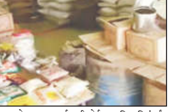
त्यामुळे वाहतूक खर्च कमी होईल आणि गरिबांपर्यंत अन्नधान्य वेळेत पोहोचेल. दुर्गम भागांना याचा सर्वाधिक लाभ होईल. रेशन दुकानदारांना सहाय्य-रेशन दुकान धारकांना डिजिटल उपकरणे दिली जातील. अन्नधान्य व्यवस्थित साठवता यावे यासाठी रेशन दुकानदारांना मदत केली जाईल. यामुळे दुकानांचे जाळे आणि कार्यक्षमता वाढेल. रेशन पुरवठ्यातील अपहार, गोंधळ कमी होतील. पीडीएसचे अत्याधुनिकीकरण-सार्वजनिक पुरवठा यंत्रणेचे आधुनिकीकरण करण्याचा सरकारचा मानस आहे. रेशन व्यवस्था आधुनिक करण्यासाठी एआयसारख्या आधुनिक तंत्रज्ञानाची अधिकाधिक जोड दिली जाईल. यामध्ये ऑटोमेशन, डिजिटल ट्रॅकिंग, ऑनलाईन मॉनिटरिंग, स्मार्ट डिव्हाईस यांचा समावेश आहे.

नागपूर-नागपूरमध्ये उष्णतेची तीव्र लाट कायम आहे. गेल्या २४ तासांत उष्णतामुळे ११ जणांचा मृत्यू झाल्याचा संशय व्यक्त केला जात आहे. नागपुरात सलग सात दिवस तापमान ४५ अंश सेल्सिअसच्या वर होते. नागपुरसह संपूर्ण विदर्भात सध्या तीव्र उष्णतेची लाट असून, नागरिकांना या उन्हाचा प्रचंड त्रास सहन करावा लागत आहे. नागपूरमध्ये बुधवारी सलग सातव्या दिवशी तापमान ४५ अंश सेल्सिअसच्या वर नोंदवले गेले. या भीषण उष्णतेच्या काळात गेल्या २४ तासांत उष्णतामुळे ११ जणांचा मृत्यू झाल्याची धक्कादायक माहिती समोर आली आहे. तीव्र उष्णतेमुळे शहरातील रुग्णालयांच्या शवागारांमध्ये अज्ञात मृतदेहांची संख्या वाढली आहे. गेल्या तीन दिवसांत शहराच्या विविध भागांतून एकूण १४ मृतदेह हाती आले असून, त्यापैकी फक्त बुधवारीच ११ मृतदेह आढळली आहेत. बहुतांश मृतदेह दुपारच्या ऱ्हास उन्हाच्या वेळी आढळल्याने हे मृत्यू उष्णताशी संबंधित असल्याचा दाट संशय आहे.