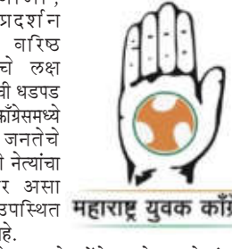
महाराष्ट्र युवक काँग्रेस

वर्तल्यात जोरदार चर्चा रंगली आहे. सामान्य कार्यकर्त्यांमध्ये मात्र या गटबाजीबद्दल तीव्र नाराजी दिसून येत आहे. जनतेचे प्रश्न सोडून नेते स्वतःची ताकद मोजण्यात व्यस्त आहेत, अशी संतप्त प्रतिक्रिया काही कार्यकर्त्यांनी व्यक्त केली. आगामी निवडणुकांच्या पार्श्वभूमीवर काँग्रेसमध्ये सुरू असलेली ही 'शक्तिप्रदर्शनाची स्पर्धा' पक्षासाठी घातक ठरणार का, असा प्रश्न आता उपस्थित होऊ लागला आहे. वर्ध्यात काँग्रेसची संघटना मजबूत करण्याऐवजी गटबाजीचे राजकारण अधिकच तीव्र होत असल्याचे चित्र सध्या दिसत आहे.