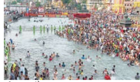
सुविधा प्रकल्पांचे प्रस्ताव राज्य सरकारकडे पाठविण्यात आले होते. यात वाहतूकाने नियोजनकरिता रस्ते, महामार्गांला जोडणारे रस्ते प्रमुखतेने बांधले जाणार आहेत. याशिवाय गोदावरीच्या घाटाकडे जाणाऱ्या रस्त्यांची दुरुस्ती केली जाणार आहे. कुंभमेळ्याच्या निमित्ताने नाशिकमध्ये येणाऱ्या वाहनांचे नियोजन करण्याकरिता अनेक ठिकाणी वाहनतळ उभारली जाणार आहेत. या वाहनतळांना

विमानतळ विकासाकरिता ५७२ कोटी खर्चण्यात येणार आहेत. तर त्र्यंबकोेश्वर परिसरातील पाणीसाठे पूर्णपणे भरण्याकरिता आणि गोदावरी नदी कायमस्वरूपी प्रवाहित राहण्याकरिता गौतमी गोदावरी धरण ते त्र्यंबकोेश्वर उपसा प्रणाली योजनेकरिता सुमारे ३२९ कोटींची तरतूद करण्यात आली आहे. बहुतांश कामे नाशिक महानगरपालिका, त्र्यंबकोेश्वर नगरपालिका, जलसंपदा विभाग, सार्वजनिक बांधकाम विभाग, एमएसआयडीसीच्या माध्यमातून केली जाणार आहेत.