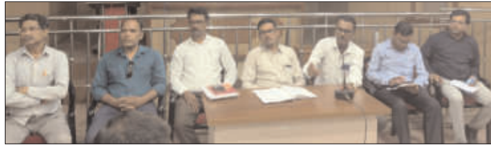
मनपात पर्यवेक्षकांची बैठक; गैरहजर कर्मचाऱ्यांवर गुन्हे दाखल करण्याचा इशारा