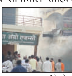
दुकानातून धूर व आगीचे लोळ बाहेर येत असल्याचे पाहून नागरिकांनी तत्काळ अग्निशमन विभागाला माहिती दिली. घटनेची माहिती मिळताच अग्निशमन दलाचे बंब घटनास्थळी दाखल झाले आणि जवानांनी शर्थीचे प्रयत्न करून आग आटोक्यात आणली. या आगीत दुकानातील मोठ्या प्रमाणावर साहित्य जळून खाक झाले असून लाखो रुपयांचे नुकसान (पान २ वर)

अचलपूर/प्रतिनिधी:- परतवाडा शहरात सातत्याने आगीच्या घटना घडत आहेत. शुक्रवारी दि.१५ मे २०२६ रोजी सकाळी छत्रपती शिवाजी महाराज व्यापारी संकुल परिसरातील आठवडी बाजारात असलेल्या 'सरगम बिअर शॉपी'ला अचानक आग लागल्याची घटना घडली. प्राथमिक माहितीनुसार विद्युत शर्षणामुळे (शॉर्ट सर्किट) ही आग लागल्याचे सांगण्यात येत आहे. आग लागल्यानंतर परिसरात एकच खळबळ उडाली.