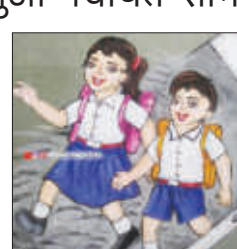
तक्रारीच्या आधारे सीताबाई संगई प्राथमिक शाळेची इयत्ता पहिलीची प्रवेश प्रक्रिया तात्पुरती थांबविण्याचे आदेश दिले असून शासनाच्या नियमानुसार पारदर्शक पध्दतीने प्रवेश प्रक्रिया राबविली जाणार आहे.

प्रक्रिया तात्पुरती स्थगित करण्यात आली आहे. या प्रकरणामुळे स्थानिक पालकांमध्ये मोठी चर्चा आणि असंतोषाचे वातावरण निर्माण झाले आहे.