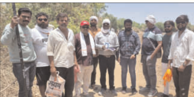
पाठपुरावा केला. परिणामी, ५ मे रोजी प्रत्यक्ष मोजणी पार पडली. यावेळी

दरम्यान, केवळ निवेदनापुरते मर्यादित न राहता राष्ट्रवादीच्या पदाधिकाऱ्यांनी नगर परिषदेकडून मोजणीचे चलन भरून घेतले व भूमी अभिलेख विभागाकडे सातत्याने