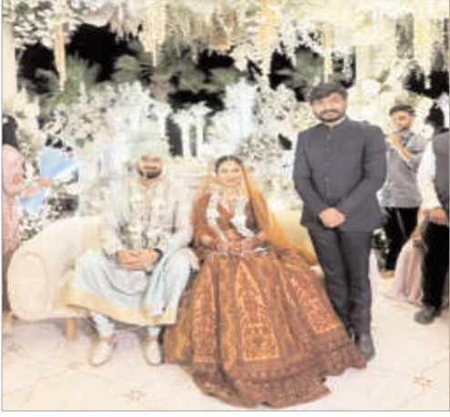
आली आहे. यातून लोकल नेते आणि व्हीआयपी नेते असे दोन

तर दुसरीकडे काही बड्या राजकीय नेत्यांना केवळ पत्रिका देण्यात आल्याची माहिती समोर