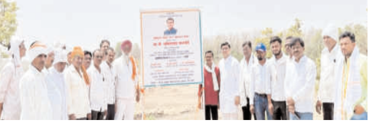
जलसंधारण व रस्ते दुरुस्तीमुळे ग्रामीण भागाला मिळणार नवे बळ

या अंतर्गत माळेगाव (काळी), आजनादेवी, बेलगाव व आजनाडोह येथील लघु सिंचन तलावांचे खोलीकरण करण्यात येणार आहे. तसेच गवंडी, मोर्शी व बांगडापूर येथे गाव तलाव खोलीकरणाची कामे सुरू झाली