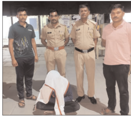
गांभीर्य ओळखून तत्काळ पोलिस पथकासह नवेगाव गाठले. घटनास्थळी चौकशी केली असता, अशी कोणतीही घटना घडली नसल्याचे निष्पन्न झाले. त्यानंतर पोलिसांनी खोटी