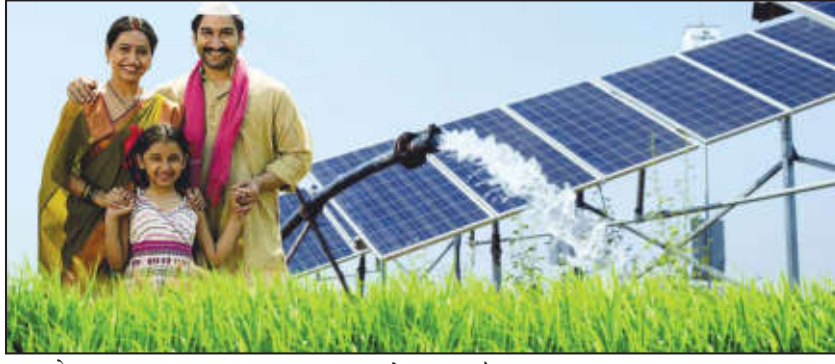
उत्तरप्रदेश- ७१ हजार ५३८, झारखंड- ६१ हजार ४५२, गुजरात- २१ हजार ८९४ अशी क्रमवारी आहे. हजार ९११ सौर कृषिपंप कार्यान्वित करण्याची विश्वविक्रमी कामगिरी केली आहे. त्याची नोंद डिसेंबर २०२५ मध्ये गिनीज वर्ल्ड रेकॉर्डमध्ये घेण्यात आली आहे.मागेल त्याला सौर कृषि पंप योजनेमध्ये सर्वसाधारण

प्रधानमंत्री कुसुम-बी आणि राज्य शासनाच्या मागेल त्याला सौर कृषिपंप