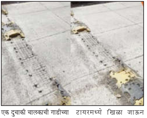
एक दुचाकी चालकाची गाडीच्या टायरमध्ये खिळा जाऊन

अचलपूर/वार्ताहर अचलपूर-परतवाडा शहरातील विविध रस्त्यांवर बसविण्यात आलेल्या स्पीड ब्रेकरमधील लोखंडी खिळे व बोल्ड उघडे पडल्याने वाहनचालकांसाठी मोठी डोकेदुखी निर्माण झाली आहे. या उघड्या खिळ्यांमुळे दुचाकी तसेच चारचाकी वाहनांचे टायर पंक्चर होण्याच्या घटना सातत्याने घडत असून नागरिकांमध्ये संताप व्यक्त होत आहे. विशेषतः रात्रीच्या वेळी हे खिळे दिसून येत नसल्याने