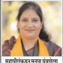
महापौरांकडून मनापा वंत्रणोला उपाययोजना करण्याच्या सूचना

संबंधित अधिकाऱ्यांना देण्यात आले असून मनापा प्रशासनाने तयारी अंतिम टप्प्यात आणली आहे. दरम्यान, संत गजानन महाराजांच्या पालखीचे शहरात आगमन होत असल्याने भाविकांमध्ये उत्साहाचे वातावरण निर्माण झाले असून पालखी मार्गावर विविध टिकाणी स्वागताची तयारी सुरू असल्याचे चित्र दिसून येत आहे. प्रशासन आणि महानगरपालिका यंत्रणा पालखी सोहळा सुरक्षित, शिस्तबद्ध आणि भक्तिमय वातावरणात पार पाडण्यासाठी सज्ज झाल्याचे या आढावा बैठकीतून स्पष्ट झाले.