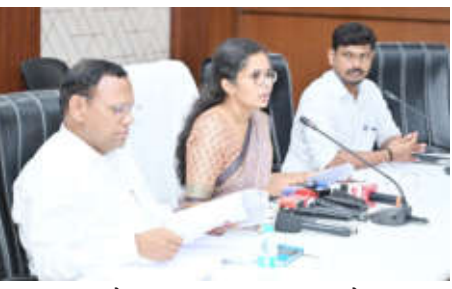
२००२ च्या मतदार यादीची प्रत उपलब्ध करून देण्यात आली आहे. या मोहिमेदरम्यान दुबार नावे, मृत व्यक्तींची नोंद, स्थलांतरित मतदार तसेच चुकीच्या तपशीलांची दुरुस्ती केली जाणार आहे.

यादी अधिक विश्वासाह भवनवावी, हा या मोहिमेचा मुख्य उद्देश आहे. यासाठी ३० जून ते २९ जुलै २०२६ या कालावधीत बीएलओ नागरिकांच्या घरी भेट देऊन माहितीची पडताळणी करणार आहेत. यावेळी मतदार वेंद्रेतचही सुसूत्रीकरण करण्यात येणार आहे.