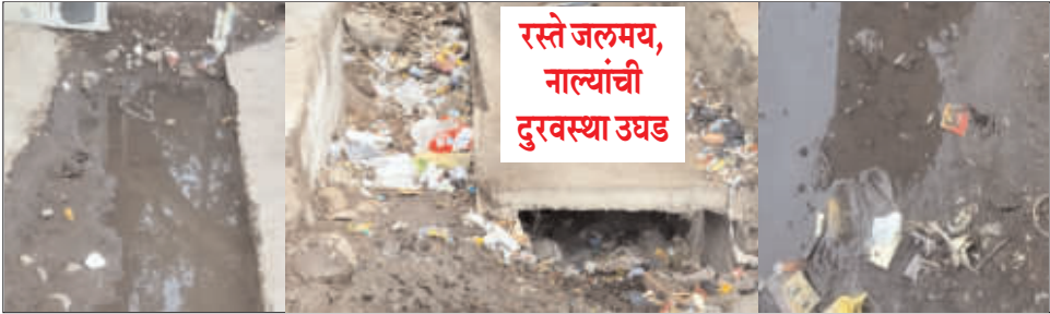
रस्ते जलमय, नाल्यांची दुरवस्था उघड