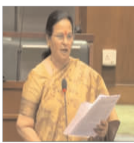
झाले आहे. जिल्हातील अवैध सावकारीबाबत शासनाने किती प्रकरणे

लाख ३४ हजार १४९ शेतकऱ्यांनी सावकारांकडून कर्ज घेतले असून अनेक शेतकऱ्यांना उच्च व्याजदराने कर्ज वाटप करण्यात आले. सद्यास्थित शेतकऱ्यांना पीक नुकसान व वाढते उत्पादन खर्च अशा समस्यांना सामोरे जावे लागत आहे. सावकारांकडून सुद्धा कर्ज भरणेबाबत तगादा लावला जात असल्याने आधीच अस्मानी व सुलतानी संकटांचा सामना करणाऱ्या शेतकऱ्यांसमोर नवे संकट उभे झाले