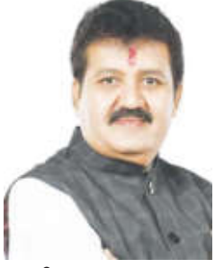
ही केवळ नियुक्ती नाही, तर देशभरातील २५ कोटी विमुक्त, भटक्या व अर्धभटक्या समाजाच्या न्याय, हक्क आणि सक्षमीकरणसाठीची मोठी जबाबदारी आहे. अशा शब्दांत नवनियुक्त राष्ट्रीय अध्यक्ष तथा मृद व जलसंधारण मंत्री ना. संजय राठोड यांनी आपले मत व्यक्त केले. शिवसेना मुख्य नेते तथा उपमुख्यमंत्री ना. एकनाथ शिंदे व

शिवसेना युवा नेते खासदार श्रीकांत शिंदे यांनी देशभरात खितपत पडलेल्या व अजूनही राहण्याला घर नसलेल्या भटक्या व विमुक्त जातीच्या उत्थानासाठी भरीव कार्य करण्याची इच्छा बोलून दाखवली. 'मी त्या समाज घटकातून येत असल्यामुळे आणि त्या प्रश्नाची जाण असल्यानेच माझ्यावर मोठ्या विश्वासाने जबाबदारी टाकली असावी. माझी ही नियुक्ती अभिमानाची असली तरी कर्तव्य पूर्ण करण्याची आहे,' असे ना. राठोड यांनी नियुक्तीनंतर झालेल्या मुल्याखतीत सांगितले.