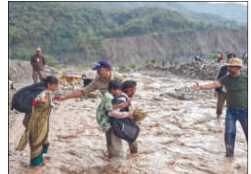
उत्तराखंडमधील नदीचा प्रवाह वाढला. सुरक्षा दलांनी ५० लोकांची सुटका केली.