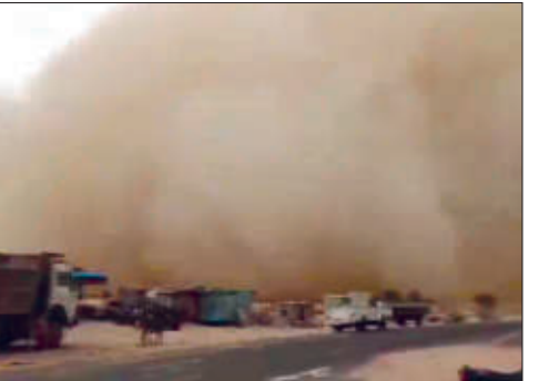
राजस्थानमध्ये सलग दुस-या दिवशी वाळूचे वादळ