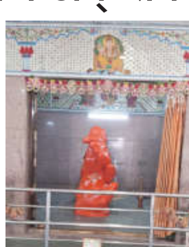
डोक्यावरील चांदीचा टोप, चांदीची छत्री तसेच चांदीची मूर्ती चोरून नेली. एवढ्यावरच न थांबता चोरट्याने मंदिरातील

आंजी (मोठी) जनमाध्यम : परिसरात चोरीच्या घटनांनी डोके बर काढले असतानाच आता चोरट्यांनी देवस्थानालाच लक्ष्य केल्याने संताप व्यक्त होत आहे. नजीकच्या सेवा येथील प्रसिद्ध हनुमान मंदिरात अज्ञात चोरट्याने धाडसी चोरी करीत चांदीचा ऐवज व दानपेटीतील रोकड असा मोठा मुद्देमाल लंपास केला. ही घटना गुरुवारी सकाळी उघडकीस आली. माहितीनुसार, रात्रीच्या सुमारास अज्ञात चोरट्याने मंदिराचे कुलूप तोडून आत प्रवेश केला. त्यानंतर मूर्तीच्या