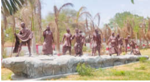
अहिंसेच्या शिल्याशेजारी निष्काळजीपणाची राख

वर्धा जनमाध्यम : महात्मा गांधी यांच्या ऐतिहासिक मिठाच्या सत्याग्रहाच्या स्मृती जपण्यासाठी शासनाने लाखो रुपयांचा निधी खर्च करून वर्धा रेल्वे स्थानक परिसरात उभारलेले आकर्षक शिल्प आणि हरित सौंदर्यीकरण आज रेल्वे प्रशासनाच्या निष्काळजीपणामुळे करपलेल्या वास्तवात उभे ठाकले आहे. उन्हाळ्यात पाण्याचा थेंब न मिळाल्याने परिसरातील विविध प्रजातीची झाडे पूर्णपणे सुकून गेली असून 'सौंदर्यीकरण' आता 'विदूषीकरण' बदलल्याची संतप्त प्रतिक्रिया नागरिकांतून उमटत आहे.