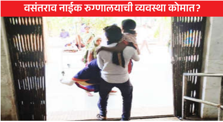
वसंतराव नाईक रुग्णालयाची व्यवस्था कोमात?

यवतमाळ, दि. ११ : यवतमाळ जिल्ह्यातील प्रमुख शासकीय आरोग्य केंद्र म्हणून ओळखल्या जाणाऱ्या श्री वसंतराव नाईक शासकीय वैद्यकीय महाविद्यालय व रुग्णालयातील एका धक्कादायक घटनेने आरोग्य व्यवस्थेच्या कार्यक्षमतेवर गंभीर प्रश्नचिन्ह उपस्थित केले आहे. सोशल मीडियावर व्हायरल झालेल्या छायाचित्र आणि व्हिडिओमध्ये पायाला गंभीर दुखापत झालेल्या एका महिलेला तिच्या नातेवाईकाने हातावर काखेत उचलून रुग्णालय परिसरात ने-आण करत असल्याचे दिसून येत आहे.