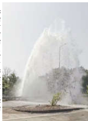
दुर्लक्ष केल्याने हा प्रकार घडल्याचा आरोप नागरिकांनी केला आहे. पाणीटंचाईच्या काळात प्रशासनाला जाग येणार

वर्धा जनमाध्यम : पाण्यासाठी नागरिकांचे हाल सुरू असताना प्रशासनाच्या हलगर्जीपणामुळे गुरुवारी येळाकेळी परिसरात पाण्याची अक्षरशः उधळण झाल्याचा संतापजनक प्रकार घडला. महाराष्ट्र जीवन प्राधिकरणाची जुनी मुख्य जलवाहिनी अचानक फुटल्याने तब्बल २० फूट उंच फवाऱ्याचा फवारा उसळला आणि शेकडो लिटर पाणी रस्त्यावर वाहून गेले. या घटनेमुळे पिपरी (मेघे)सह १३ गावांचा पाणीपुरवठा विस्कळीत झाला.