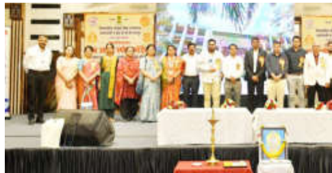
या मध्ये हब अँड स्पोक कसे काम करते या विषयी माहिती दिली. तसेच THOTA कायदा, अवयव दानासाठी रुग्णालयाची तयारी व परवानगी याविषयी सविस्तर माहिती, रुग्णाच्या नातेवाईकांशी समुपदेशन कसे करावे याविषयी माहिती, मेंदू मृत रुग्ण कसा ओळखावा व त्यासाठी कोणती टीम आवश्यक असते त्याविषयी संपूर्ण माहिती या एक दिवसीय कार्यशाळेत देण्यात आली. या कार्यशाळेत अवयवदान व प्रत्यारोपण प्रक्रियेतील विविध पैलू, अवयवदानाचे महत्त्व, समन्वय प्रक्रिया तसेच 'हब अँड स्पोक मॉडेल'ची प्रभावी अंमलबजावणी याविषयी सविस्तर माहिती देण्यात आली.