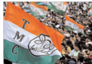
लोकशाहीत विरोधी पक्षांचे

मुख्य कर्तव्य जनतेच्या अन्यायाविरुद्ध आवाज उठवणे हे असते. दुर्दैवाने, काँग्रेस आणि डाव्या पक्षांनी बंगालमधील जनतेला पूर्णपणे वाऱ्यावर सोडले. जेव्हा जेव्हा स्थानिक पातळीवर कायदा आणि सुव्यवस्थेचा बोजवारा उडाला, तितकीच काँग्रेससह समस्त विरोधी पक्षांची लाचारीही जबाबदार आहे.