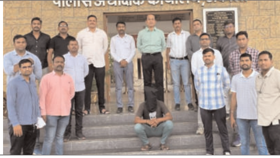
पोलीस अधीक्षक कार्यालय अकोला