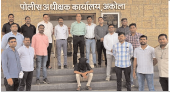
पोलीस अधीक्षक कार्यालय अकोला

जिल्ह्यात एका दिवसात घडलेल्या दोन भीषण हत्याकांडांनी कायदा-सुव्यवस्थाबाबत प्रश्न निर्माण केले असतानाच स्थानिक गुन्हे शाखा (एलसीबी) आणि संबंधित पोलिसांनी दाखविलेल्या वेगवान कारवाईने गुन्हेगारांना जबरदस्त धक्का दिला आहे. पातूर तालुक्यातील आलेगाव येथील अल्पवयीन मुलाच्या खूनप्रकरणातील तीन आरोपींना अवघ्या सहा तासांत जेरबंद करण्यात आले, तर अकोला शहरातील तारफैल भागातील खूनप्रकरणात १२ तासांच्या आत एका आरोपीला अटक करण्यात यश आले. जिल्हा पोलिसांनी रात्रीदिवस राबविलेल्या शोधमोहिमेमुळे फरारी आरोपीचे मनसुबे उधळले गेले.