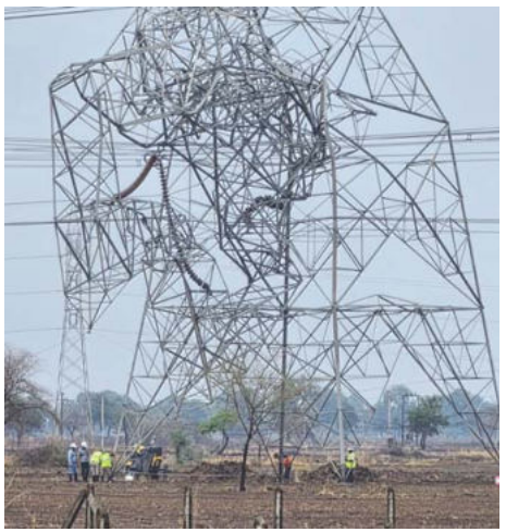
अमरावती-परतवाडा रोडवरील आष्टी ते पूर्णा नगर दरम्यान उच्च विद्युत दाब वाहणीची झालेली वाताहत.