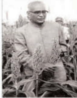
स्तरावर ज्या जिल्हा नियोजन समिती अस्तित्वात आल्या, त्या त्यांच्याच संकल्पनेतून अस्तित्वात आल्या आहेत. 'दिल्लीत बसून ग्रामीण भागाचे नियोजन कसे करता येईल?' असे त्यांनी टणकावून सांगितले होते.

महामंडळची स्थापना केली. तत्पूर्वी शेतकऱ्यांना शेतीचे तंत्र अचूक ठेवणे, या उद्देशाने त्यांनी महाराष्ट्रात ४ कृषी विद्यापीठांची निर्मिती केली. या विद्यापीठांतील शास्त्रज्ञ शेतकऱ्यांच्या बांधापर्यंत जावे आणि विद्यापीठाच्या शिबारा पाहणीसाठी शेतकरी सहजपणाने यावा, हा यामागचा उद्देश होता. ज्येष्ठ कृषी शास्त्रज्ञ डॉ.एम.एस. स्वामिनान्न हे नाईक साहेबांच्या कार्यकर्तृत्वाची आठवण करताना म्हणतात, 'माजी पंतप्रधान लालबहादूर शास्त्री यांनी त्याकाळात 'जय जवान, जय किसान' असा नारा देऊन देशात कृषी क्रांतीची ज्योत पेटविली होती, वसंतराव नाईकांनी ती ज्योत सतत तेवत ठेवण्याचे काम केले. 'शेती मालाला चांगला भाव मिळायला म्हणून राज्यात कापूस एकाधिकार खरेदी व ज्वारी खरेदी योजना आणली. शेतकरी मोठ्या कष्टाने पिकवतो, नैसर्गिक संकट आले तर ज्वारी काळी पडते आणि काळी ज्वारी व्यापारी घेत नाहीत, त्यासाठी काळी ज्वारी हमीभावाने घेण्याचा निर्णय त्यांनी घेतला. या योजनेला त्यावेळी केंद्रीय कृषी मंत्र्यांनीच विरोध केला होता. पण ही योजना किती महत्त्वाची आणि हिताची आहे, हे पटवून देण्यात ते