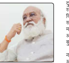
युवकांना राष्ट्रहिताच्या विचारांशी जोडणे आणि संघटनेत मजबूत करणे, हे त्यांचे अखंड ध्येय होते.

ज्या काळात पक्षाकडे सत्ता नव्हती, साधने नव्हती आणि अनेक ठिकाणी पक्षाचे नावसुद्धा फारसे परिचित नव्हते, त्या काळात त्यांनी गावोगावी जाऊन विचारांची भशाल पेटती ठेवली. प्रत्येक गावात कार्यकर्ते तयार करणे, शाखा उभ्या करणे,