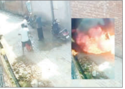
ही घटना १३ जून रोजी घडली होती, या घटनेचा व्हिडीओ आता सोशल मीडियावर व्हायरल झाला असून संपूर्ण देश हादरला आहे. पोलिसांनी दिलेल्या (पान २ वर)

तरनतारन/वृत्तसंस्था - पंजाबमधील तरनतारन जिल्ह्यातून एक धक्कादायक घटना समोर आली आहे. आपल्या रुसलेल्या पत्नीला मनवण्यासाठी सासरच्या घरी पोहोचलेल्या एका व्यक्तीवर त्याच्या मेढण्याने भररस्त्यात पेट्रोल ओतून त्याला जिवंत जाळले. या भयंकर आगीत होरपळून जावयाचा जागीच मृत्यू झाला. धक्कादायक बाब म्हणजे, त्याला वाचवण्यासाठी धावून आलेली त्याची मेहुणीही या आगीत गंभीररीत्या भाजली होती, तिचाही उपचारदरम्यान मृत्यू झाला आहे.