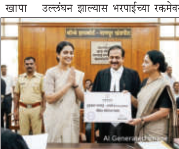
भरपाईची रक्कम अदा करण्यासाठी राज्य सरकारला दोन महिन्यांची मुदत देण्यात आली आहे. या आदेशाचे ३ जुलैपासून ते प्रत्यक्ष रक्कम अदा करण्याच्या तारखेपर्यंत आठ टक्के व्याज लागू होईल, असे स्पष्ट करण्यात आले आहे. तसेच, ही (पान २ वर)