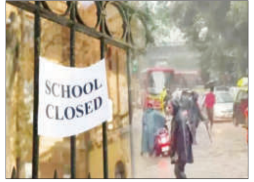
कार्यालये मात्र नेहमीप्रमाणे नियमितपणे सुरू राहतील. त्यामुळे नोकरदार वर्गाला कार्यालयात जावे लागणार आहे.

मुंबई/प्रतिनिधी : मुंबईसह संपूर्ण उपनगरे आणि लगतच्या जिल्ह्यांमध्ये पावसाने रौद्ररूप धारण केले आहे. गेल्या दोन दिवसांपासून सुरू असलेल्या संततधार आणि मुसळधार पावसामुळे ठाणे आणि रायगड जिल्ह्यातील अनेक सखल भागांत पाणी साचले असून पूरसदृश परिस्थिती निर्माण झाली आहे. हवामान विभागाने उद्या सोमवार, दिनांक ६ जुलै २०२६ रोजी या भागात 'ऑरेंज अलर्ट' जारी करत अत्यंत मुसळधार पावसाचा इशारा दिला आहे. या पार्श्वभूमीवर