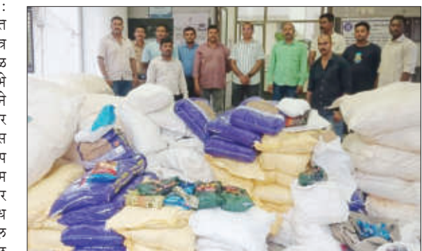
हा व्यवसाय अनेक वर्षांपासून करत आहे. कायद्यातील त्रुटीमुळे त्याच्यावर कठोर कारवाई झाली नाही. यापूर्वी त्याला पांढरकवडा येथे टोलनाक्यावर गुटख्यासह पकडण्यात आले होते. २०२३ मध्ये अन्न सुरक्षा अधिकारी व पोलिसांनी पांढरकवडा येथे त्याच्याविरुद्ध (पान २ वर)